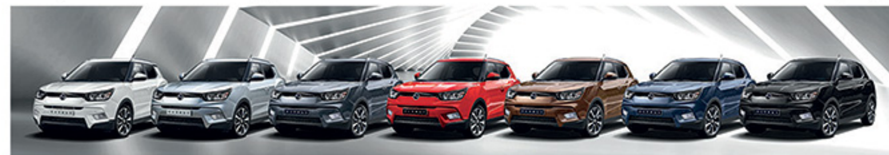
سفید روغنی نقره ای متالیک خاکستری تیره متالیک قرمز متالیک قهوه ای متالیک آبی متالیک مشکی متالیک